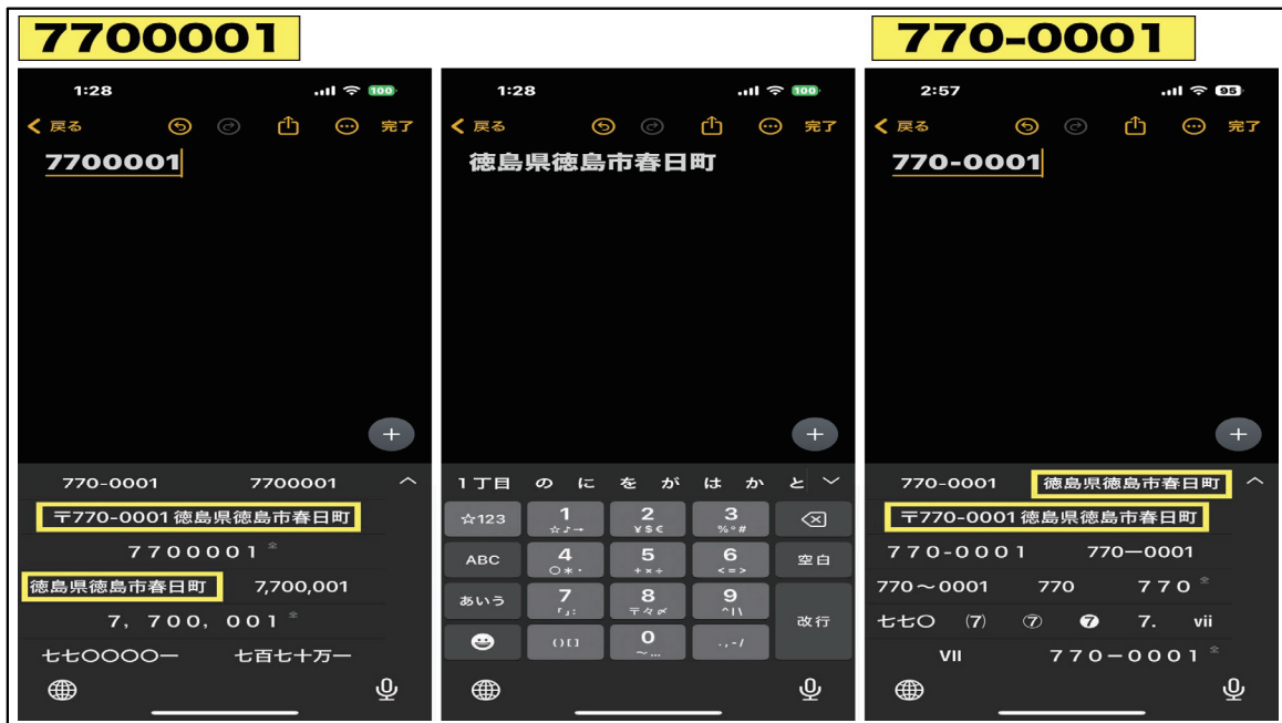
図9：郵便番号による住所入力

次は、郵便番号による住所入力です。図9には『7700001』と入力していますが、候補語の中に『徳島県徳島市春日町』が表示されています。『770-0001』でも同様に表示されます。皆さんも御自宅や職場の郵便番号を入力してみてください。