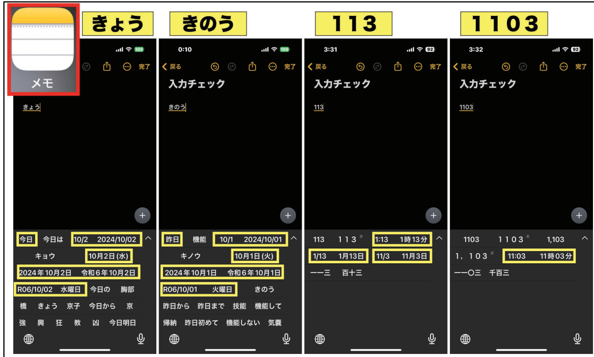
図8：日付と時間入力例