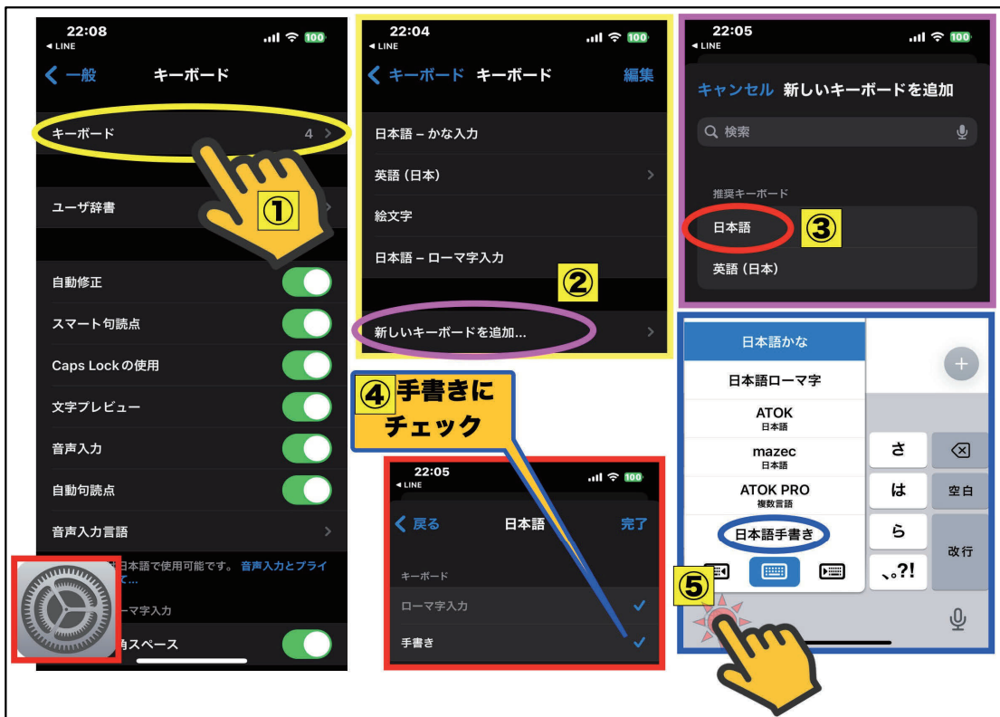
図12：日本語手書き入力の設定方法