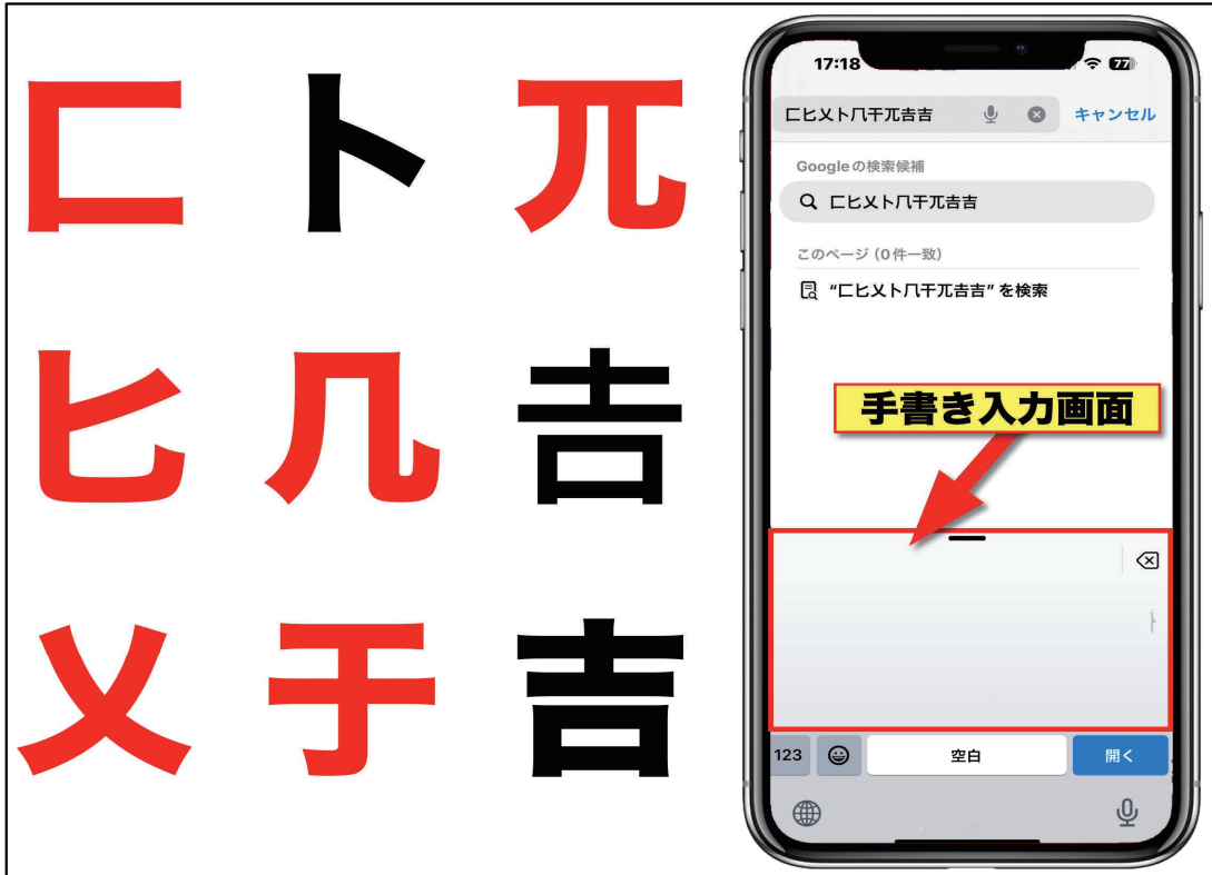
図11：入力が難しい漢字例