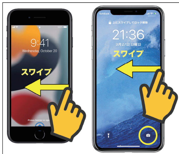
図4：ロック画面からのカメラの起動方法

この方法も以前に説明しました 1) が、最も簡単な方法を再度紹介します。シャッターチャンスを見逃さないために手持ちのiPhoneから即座に『カメラ』を起動するには、ロック画面の右端から左へ指をスワイプすると、『カメラ』が起動します(図4)。『パスコード入力』も『指紋認証(Touch ID)』も『顔認証(Face ID)』もありません。ロック画面右下の『カメラ』のアイコン(図4 黄○)を強く押しても『カメラ』を起動することはできますが、スワイプの方がより早く『カメラ』を起動することができます。