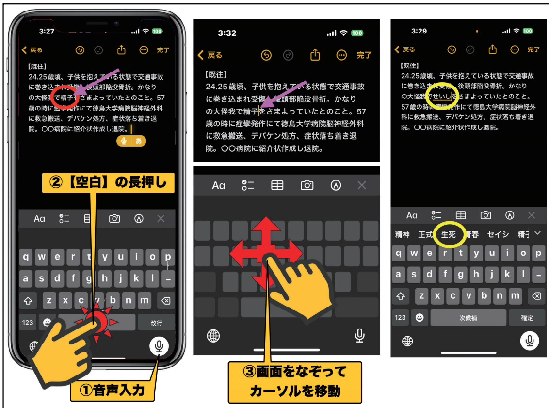
図5：音声入力とカーソル移動を利用した日本語文章の入力例

ここで簡単にカーソルを移動するTipsを紹介いたします。キーボードの【空白】と表示された部分をタップしたまま1-2秒待ってみてください（図5-②）。するとキーボード部分の文字が消え、この状態で指を動かすと、カーソルが自由に動くことが確認できるかと思えます。カーソルを目的の場所に移動し、指をはなすと文字盤がでてきますので、単語を修正することが可能となります（図5 黄○）。