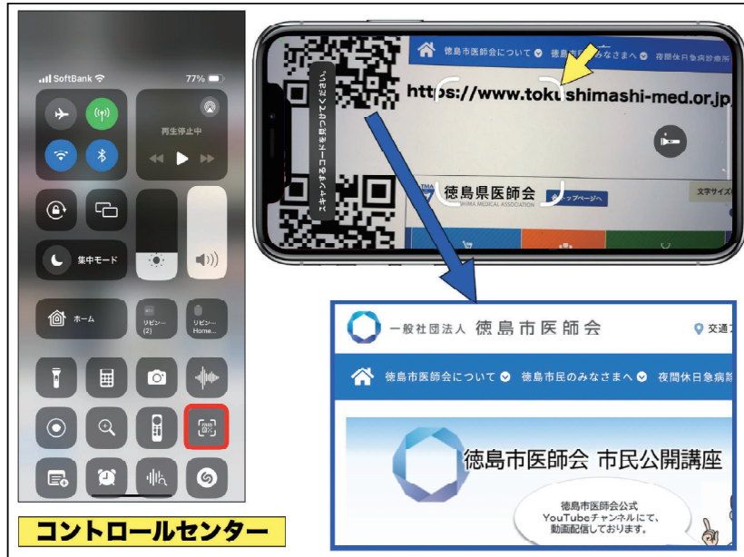
図3：コントロールセンターのコードスキャナーを利用したQRコード判読方法