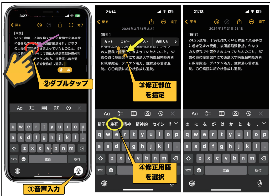
図6：ダブルタップによる単語選択と修正例

文字修正のTipsです。キーボードへの新たな単語入力なしに、「せいし」の候補用語がキーボードに自動的に表示されますので、その中から「生死」をタップする（図6-④）と入力文書の単語が修正されます（図6 右）。