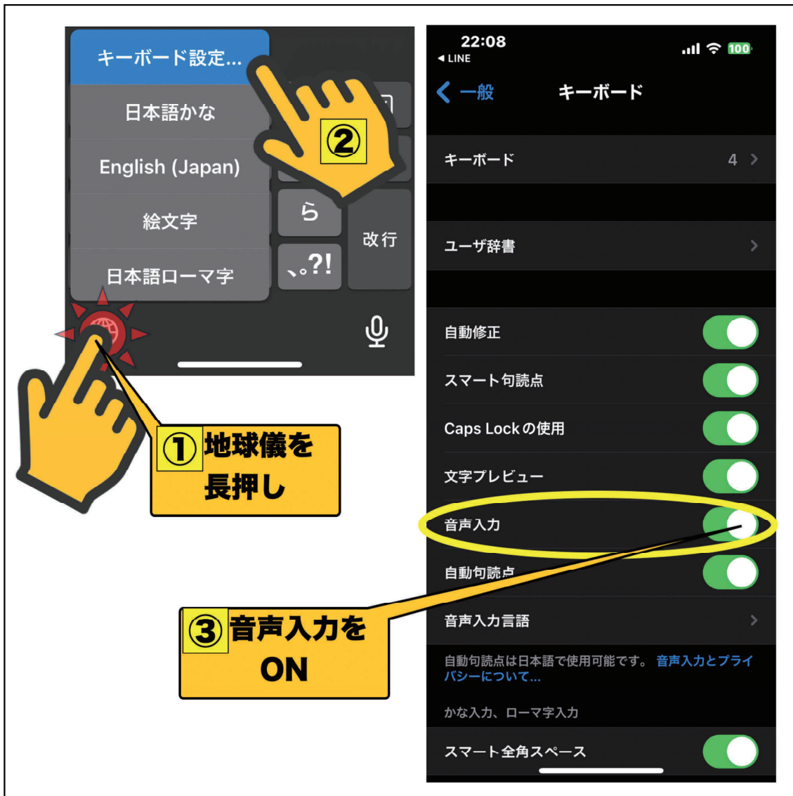
図7：キーボード設定の Tips

②)。キーボード設定画面が表示されますので（図7 右）、【音声入力】をONに変更すると、キーボードにマイクが出現し、音声入力が可能となります。