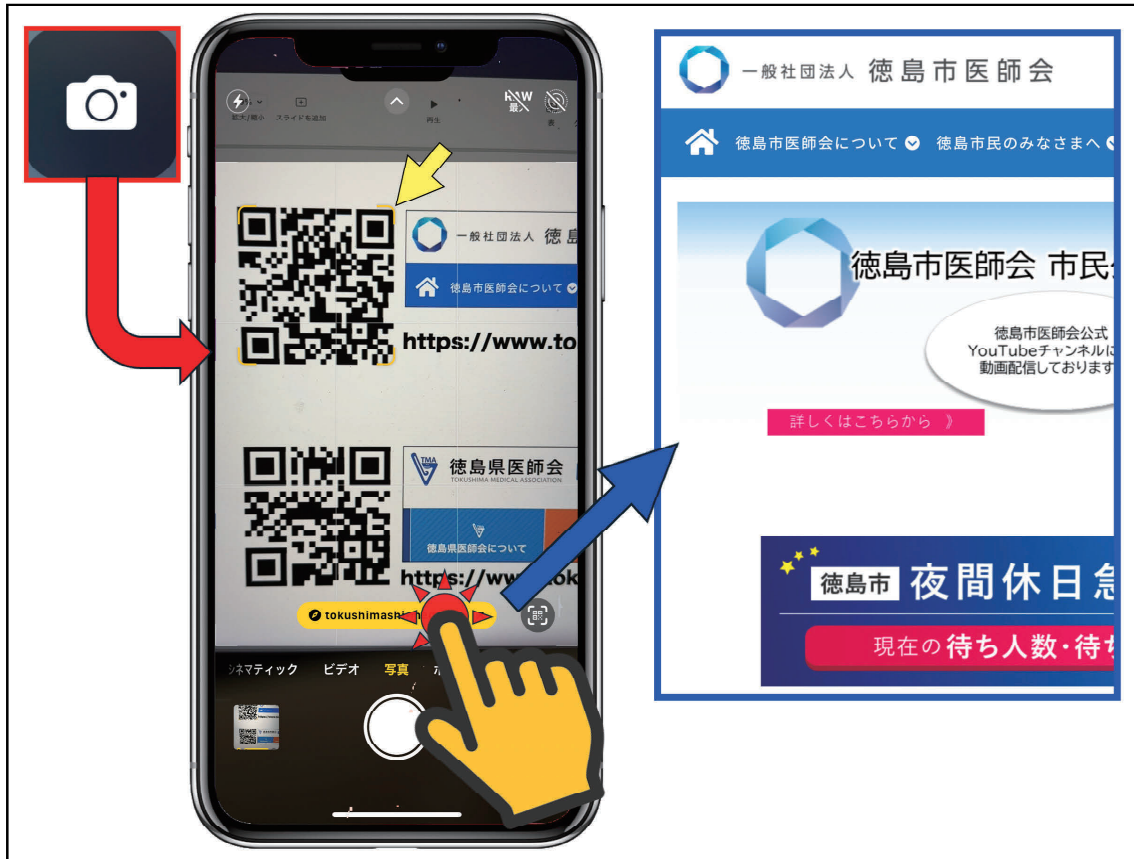
図2：カメラを利用したQRコード判読方法

カメラを起動し（図2 赤□）、図1をカメラで覗いてみて下さい。薄い黄色の枠でQRコードが囲まれ（図2 黄矢印）、画面下にそのQRコードのURLが表示されますので、これをタップしてみてください（図2 指マーク）。即座にSafariなどのWebブラウザが起動され、医師会のホームページが表示されます（図2 右）。