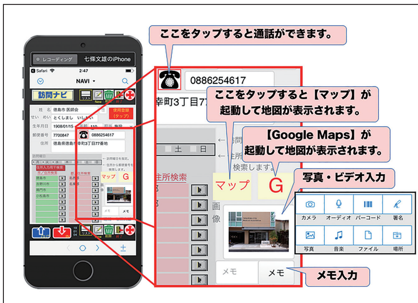
図 8 : 『訪問 NAVI』 の初期画面の説明 2

更に、メモ、担当者（担当者の代わりにジャンル別の分類としても入力できます）、訪問曜日の入力も可能です。