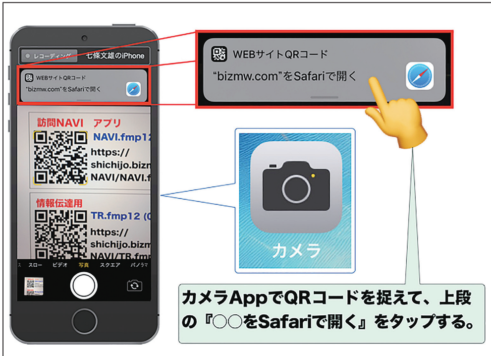
図4：カメラを利用してQRコードを読み取る方法

もし、QRコードの読み取りが出来ない場合には、【設定】→【カメラ】→【QRコードをスキャン】のボタンを右に動かして【ON】の状態にすると、【カメラ】を利用したQRコードの読み取りが可能となります（図5）。