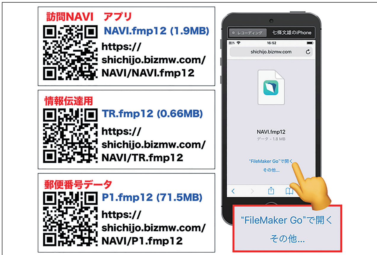
図3：『訪問 NAVI』の3個のファイルセット

URL： https://shichijo.bizmw.com/NAVI/P1.fmp12