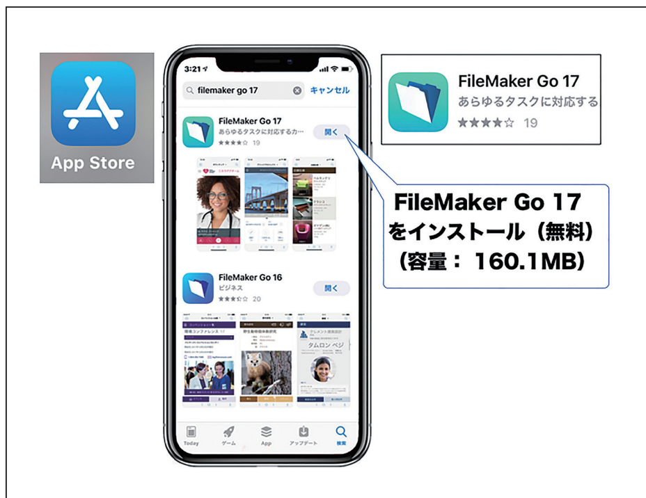
図2 : App Store から FileMaker Go 17をインストール

1) 先ず最初に iOS 用アプリの FileMaker Go 17を App Store からダウンロードして iOS 機器にインストールします (図2)。