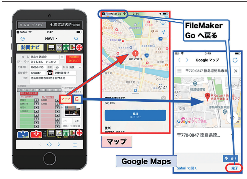
図9：【マップ】と【Google Maps】による目的地の地図表示例

【マップ】 ボタンをタップすると地図アプリの【マップ】が、【G】 ボタンをタップすると地図アプリの【Google Maps】が起動され、目的地の位置が表示されます。後は、各アプリを利用して、経路探索を行ってください。FileMaker Goに戻るには、左上もしくは右下の表示をタップするだけで元の画面に戻ります（図9参照）。