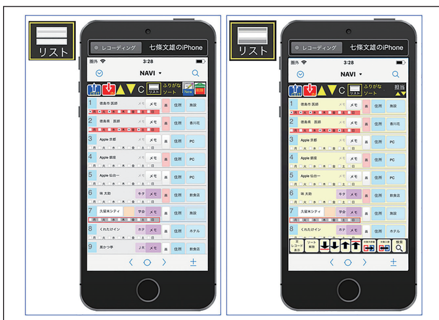
図10：リスト画面の表示例（著者の学会出張に利用）

【リスト】 ボタンを押すと、2種類のリストが表示されます（図10）。この詳細は次回の【～応用編～】で解説します。左端の【数字】をタップすると、初期画面にもどります。