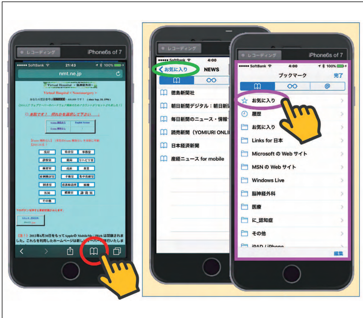
図16 ブックマークを利用したお気に入りの編集方法 その1

次に、リスト最上段の【☆ お気に入り】(図16 紫○)を指でタップします。図17左の赤□は、タップ後の画面です。それでは、右下に表示されている【編集】(図17 赤○)をタップしてみてください。すると、図17右のような編集画面が表示されます。右端の【リストマーク】(図17 青○)を指で上下にドラッグして動かすとフォルダやwebページのタイトルを上手に上下に動かす事ができます(図17 青□)。この順序が、【☆ お気に入り】画面でのアイコンの表示順序となります。左端の赤マークをタップすると【削除ボタン】が表示されます(図17 紫□)。この【削除ボタン】をタップすれば即座にwebページやフォルダがリストから削除されます。