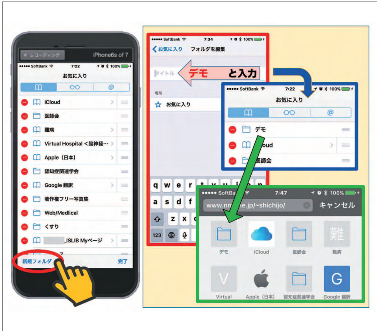
図18 ブックマークを利用したお気に入りの編集方法 その3

次は、各種項目のフォルダ内への格納法です。ここでは、『Apple（日本）』のweb ページ表示項目を『デモ』のフォルダ内に格納する方法を練習してみます。まずはお気に入りの編集画面で『Apple（日本）』をタップします（図19 赤○）。タップにより、指定された項目の編集画面が現れます（図19右）。現在の場所は『☆ お気に入り』となっています（図19 青○）。ここで『お気に入り』をタップすると、格納できるフォルダのリストが表示されます（図19 青□）。それでは、『デモ』のフォルダに格納してみましょう。『デモ』フォルダをタップしてみてください。すると、先程の『Apple（日本）』の場所が『デモ』に変わっていると思います（図19 紫○）。これでフォルダ移動は完了です。実際のお気に入り画面で確認してみてください。