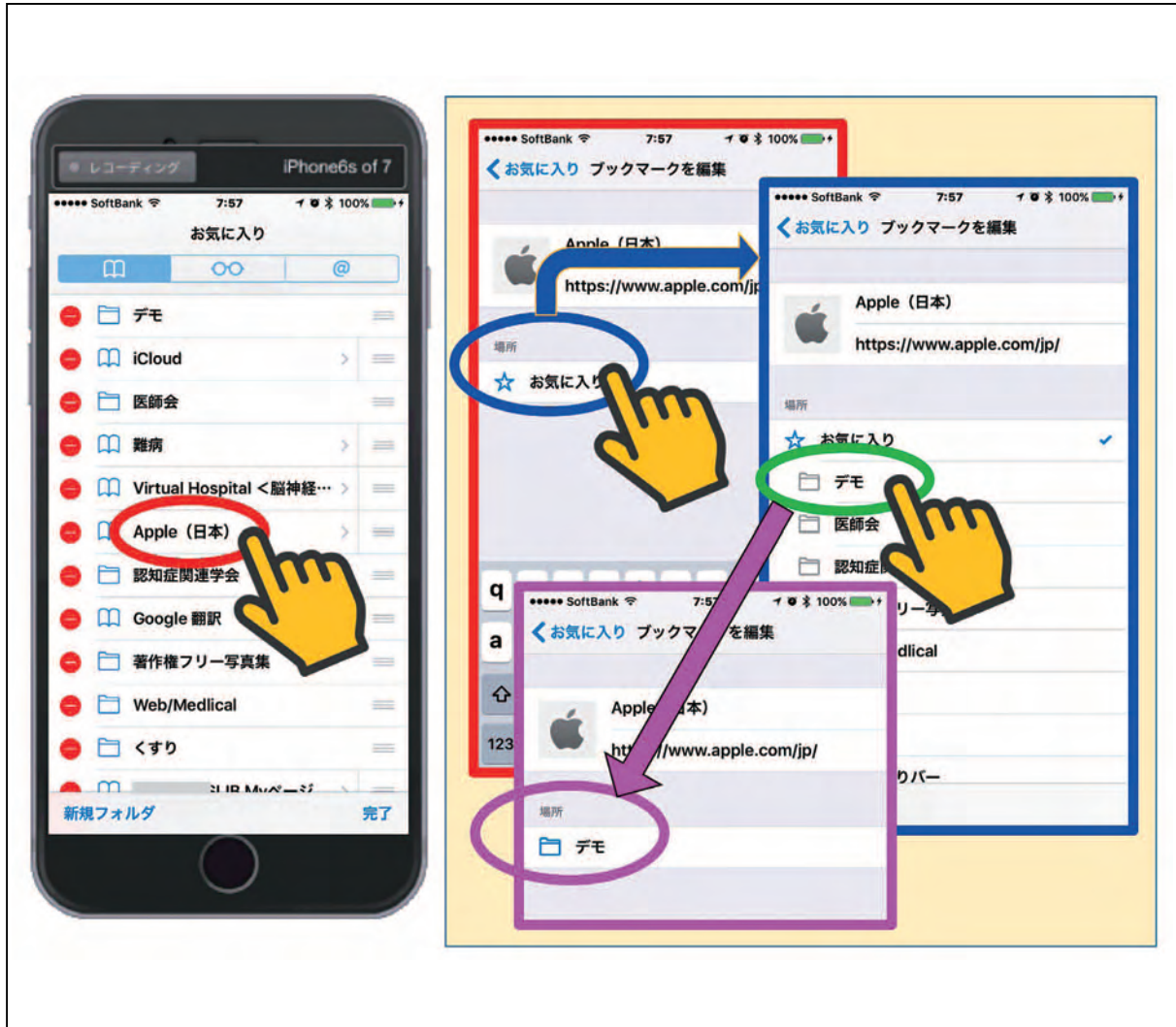
図19 ブックマークを利用したお気に入りの編集方法 その4