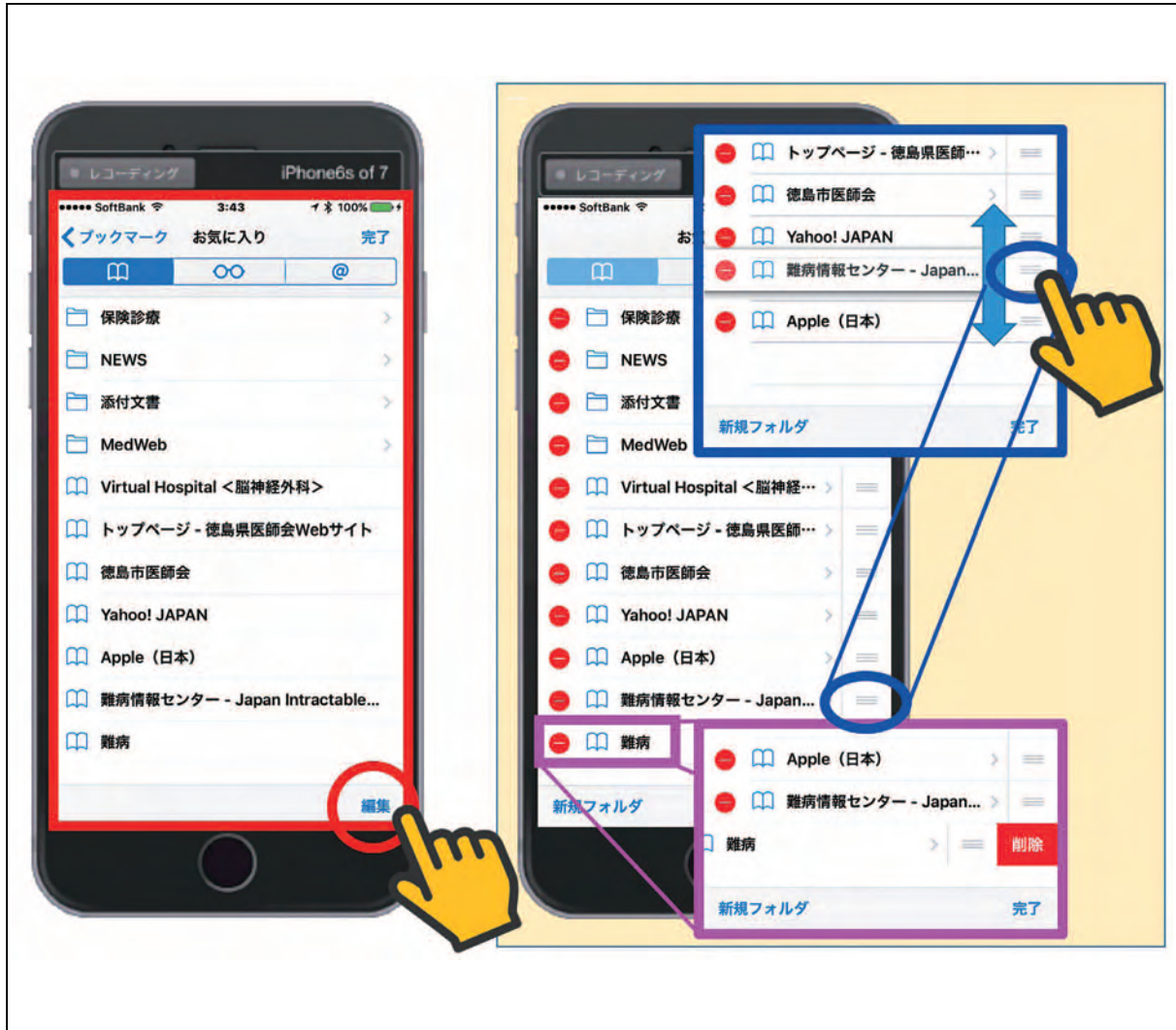
図17 ブックマークを利用したお気に入りの編集方法 その2

それでは、次にフォルダを作成してみます。【編集】をタップして表示された編集画面の左下に表示された【新規フォルダ】をタップしてみてください（図18 赤○）。画面が図18右のような、フォルダ編集画面に変わり、フォルダのタイトル名をきいてきます。ここでは、仮に『デモ』と入力してみてください（図18 赤□）。次に表示されているキーボード右下の【完了】をタップすれば入力は終了です。新たに作成されたフォルダは、【お気に入り】のリスト画面（図18 青□）では最上段に、アイコン表示画面（図18 緑□）では最上段の左端に配置されます。