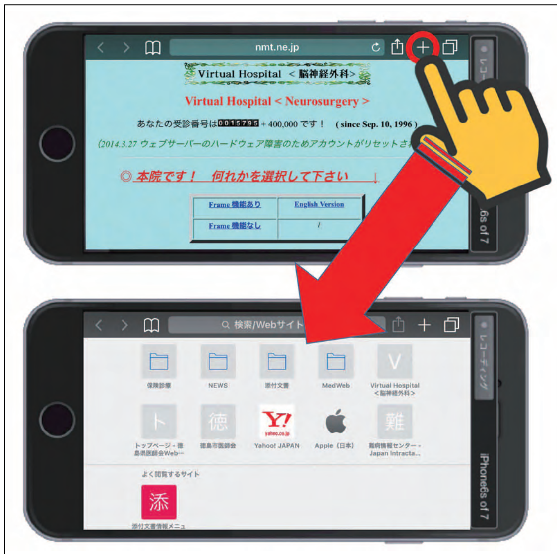
図15 iPhone の横画面表示でのお気に入り表示方法②（上段）と実際のお気に入り画面の表示例（下段）

iPhone の横画面表示と iPad では、上段の【+】ボタン（図15 赤○）をタップ（表示方法②）しても、同様にお気に入りの画面（図15下段）が表示されます。