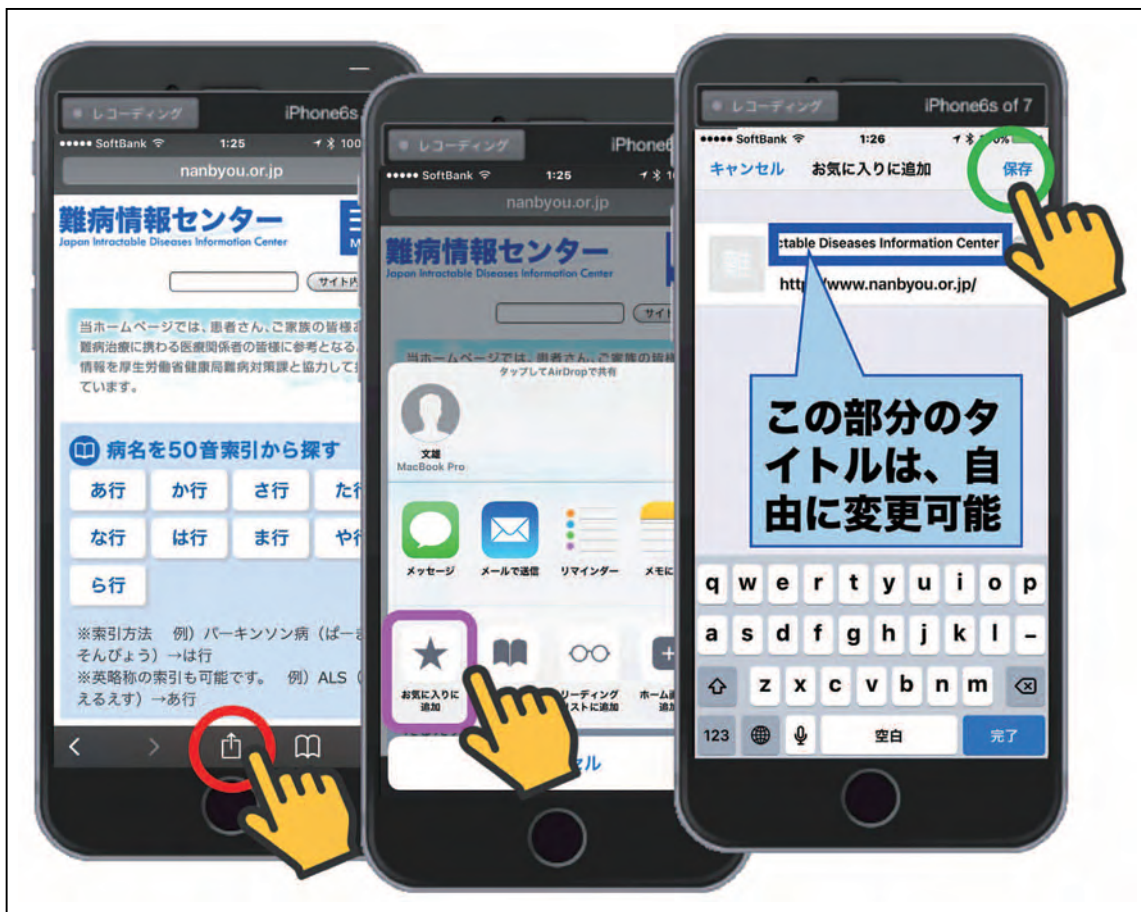
図13 【☆ お気に入りに】の設定方法

次は、皆さんご自身での実演です。様々なお気に入りのWeb ページを【☆ お気に入りに】に登録してみてください。