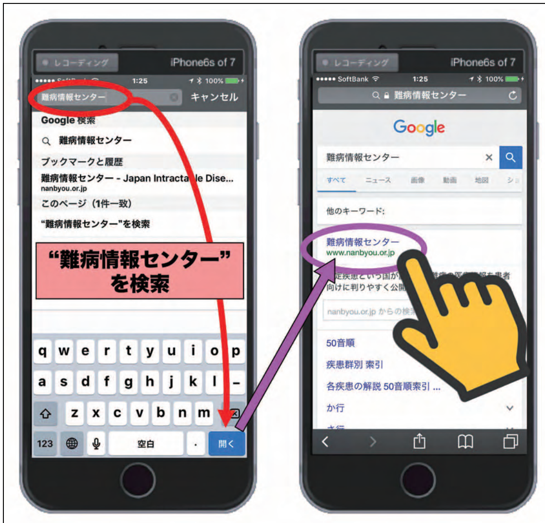
図12 “難病情報センター”の検索例を表示

それでは、読者の先生方と一緒に実際に Web ページを登録してみます。先ず Safari で“難病情報センター”を検索してみて下さい（図12）。