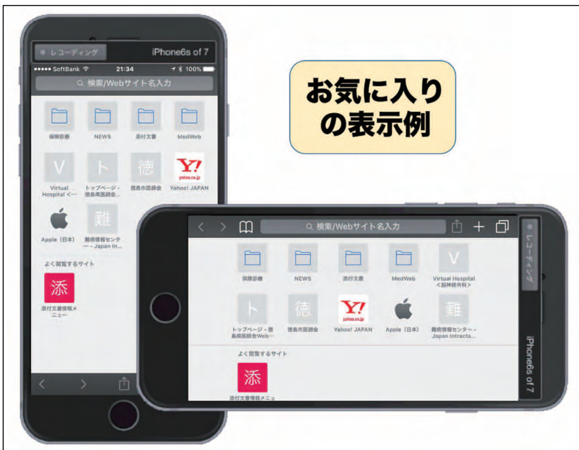
図11 iPhone での【☆ お気に入り】の表示例

以下に、iPhone での操作を中心に【☆ お気に入り】の設定方法を紹介いたします。